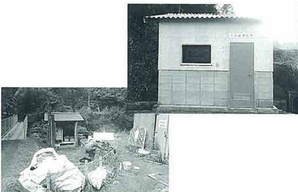
上戸川小水力発電設備

町に於いては全町域で指定されている。更に「日之影町景観条例」開発面積が500㎡以上のものや一定の高さを超える構造物については、事前の届け出が必要であり、主旨を広く町民に理解して戴く必要がある。「地域還元型自然エネルギー」の導入につきましては、その地域が未来永劫維持され、活性化されるよう推移を見守りたいと思います。