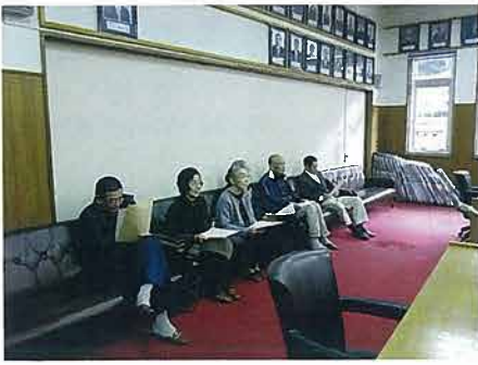
議会傍聴の皆さん