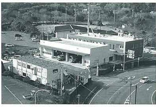
建設中の西臼杵広域消防本部

署・宮崎県消費生活センター延岡支所等の関係団体と連携を図りながら、特殊詐欺等のトラブルに巻き込まれないよう啓発を行うと共に、トラブルが発生した場合は、迅速に関係機関が連携して対応を行っている。