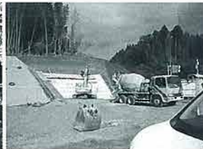
柵木住宅団地造成事業

り、3名の方の農家を視察した。皆さんそれぞれに創意工夫され、頑張っておられる様子が伺えた。更に努力されて、日之影のモデル農家、また地域のリーダーになられることを期待したい。