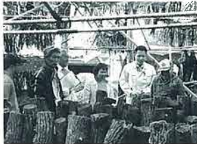
椎茸栽培に取り組む