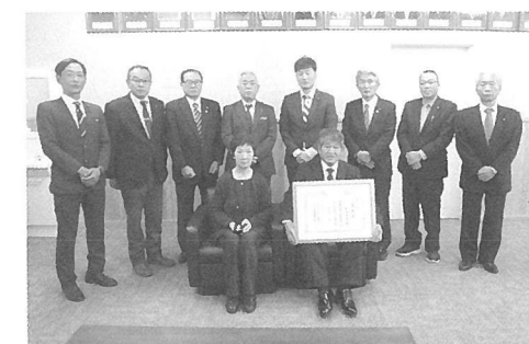
岩田氏農事功労表彰報告