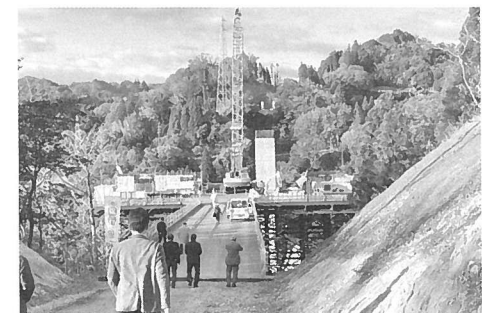
郡議員大会・研修