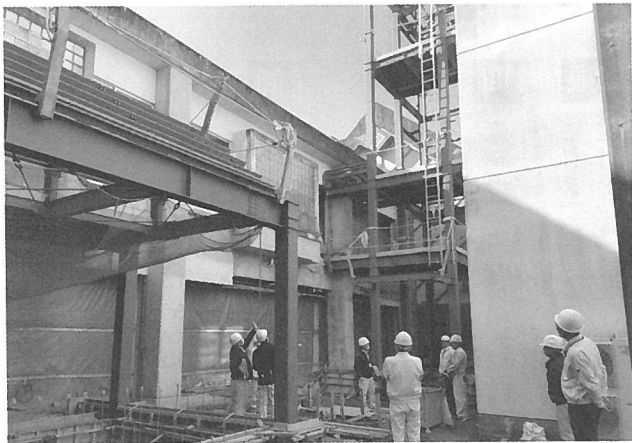
中学校エレベーター設置工事の様子

ム等で、月額72,820円、年873,840円が見込まれている。また、校内バリアフリー化事業も目指し、並行して行われている所であり、今後とも安全第一を基本に工期内の完成を求め、完成後のエレベーター利用については、学校参観、高齢者への配慮も十分検討する事が肝要である。