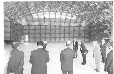
郡林活協議会視察研修