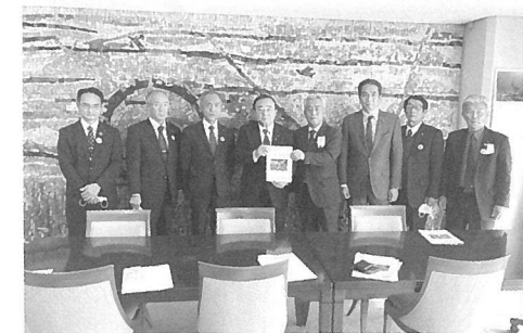
中央道整備促進西臼杵議会特別委員会要望