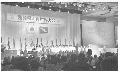
シーガイア・コンベンションセンターにて