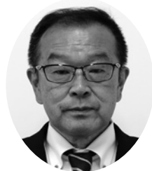
彦 睦 甲 斐 議