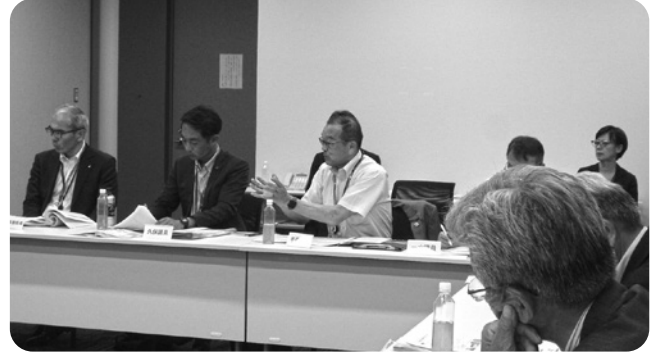
【買い物支援について】