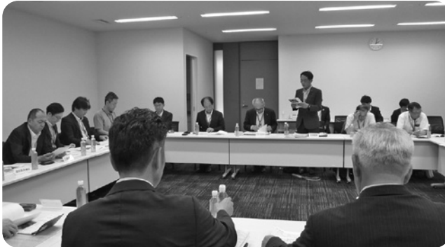
【新規就農の促進について】