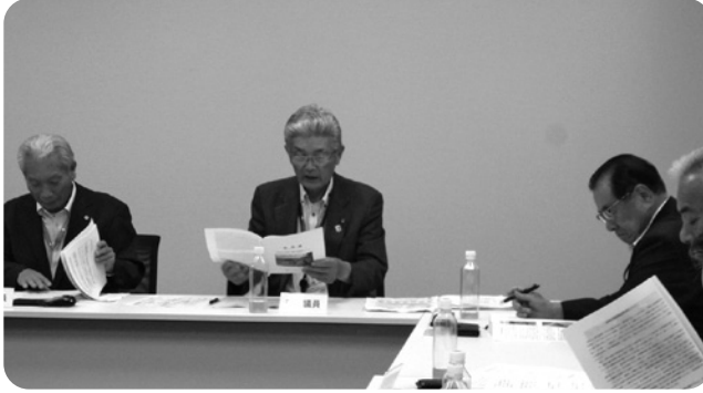
【電波状況の改善について】