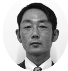
一 優員 久 保 議