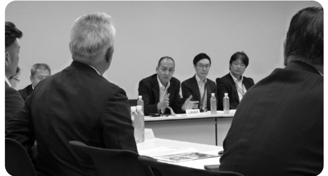
【畑地化事業について】