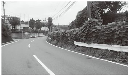
◀ 防草モルタル施工箇所