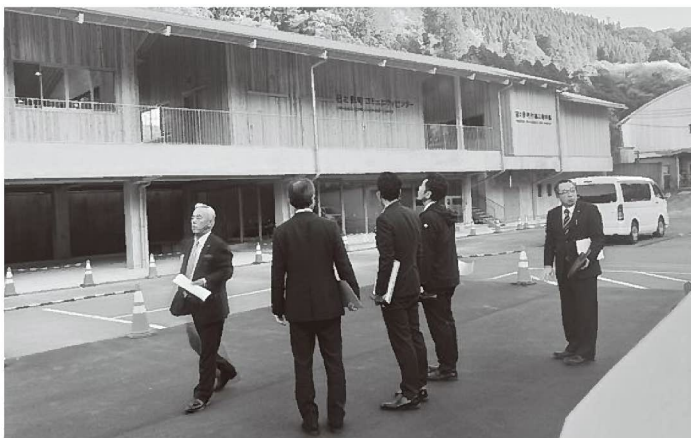
▶ 特別委員会での調査

広場、遊具も備え付けられ人々が癒しを求めて集まれる場所にリノベーションできている。 今後は未決定テナントの活用状況にも注視し、特別委員会としても情報収集に務めより良き提案を行うべく調査を継続していく。