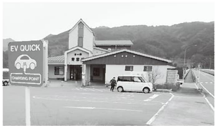
◀ 道の駅 青雲橋