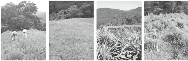
宮崎市高岡町における耕作放棄果樹園（ミカン園）跡地の矮性ネピアグラス移植による黒毛和種繁殖牛の放牧利用

町長 行政が行うには様々な検証が必要であるが実証実験は小規模なものでも良いので検討する。良い結果が出たのならば普及を進めて行けば良いと思う。