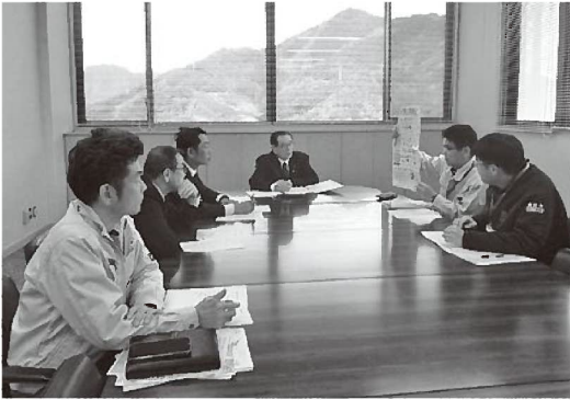
ゴミの分別について説明を受ける委員