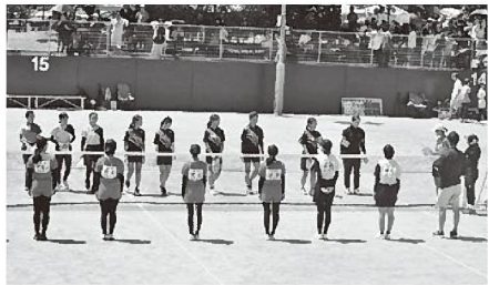
◀ 県大会に出場したテニス部